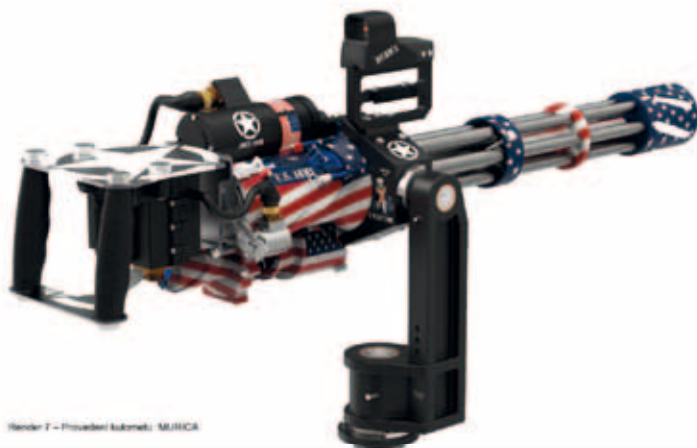
Render 7 – Provedení kuberneti: MURICA